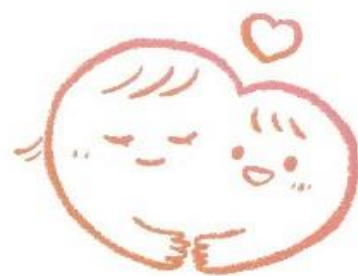
寄り添い型の総合支援